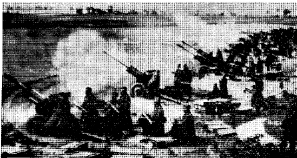
Sovjetisk artilleri i kamp.