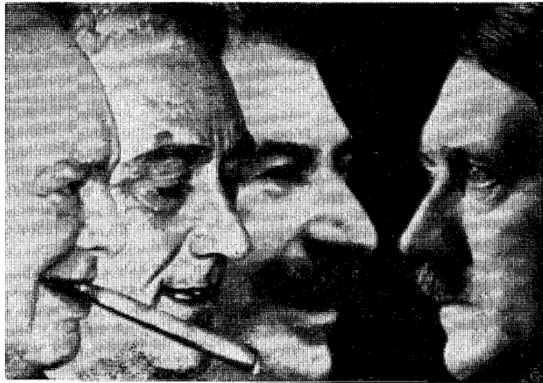
Verdenskrigens «fire store».

SVEN HEDIN: «Intet er mere forståelig enn dette, hvorfor det så hurtig etter 1. verdenskrig kom til nye katastrofer. Mange var svært raske med svar på rede hånd: Fredsforstyrren var og er påny TYSKLAND. Dette «påny» viser bare straks hvor kjapt folk i det korte