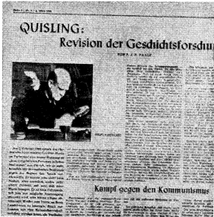
Anmeldelsen i NATIONAL-ZEITUNG.