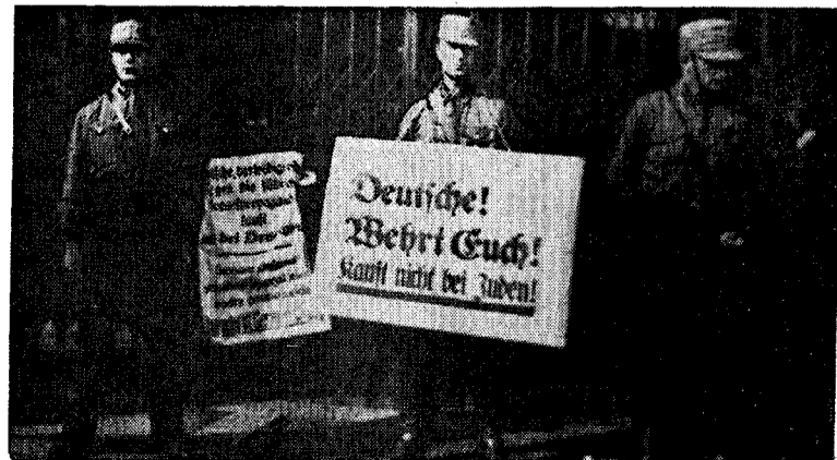
SA-folk demonstrerer foran jødisk butikk i Berlin.

La oss da først og fremst slå fast at antisemitismen ikke var noe spesielt tysk fenomen. Det var særlig i Øst-Europa den hadde sin store utbredelse og hvor det med jevnlig mellomrum fant sted pogromer. Ja, den dag idag beskyldes jo både Sovjetsamveldet og dets satellitter for antisemitisme i den vestlige presse. I Tyskland var det masseinvasjon av østjøder etter første verdenskrig som førte til en fiendtlig innstilling mot jødene. Det skyldtes dels deres fremmedartede utseende, men i enda høyere