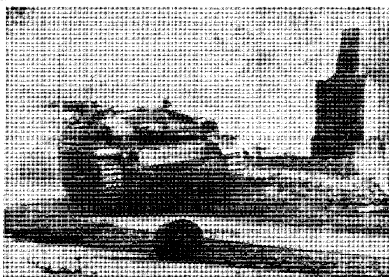
En tysk tank kjørte ut til siden.