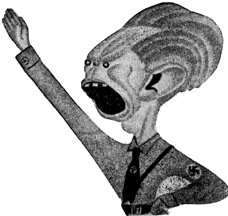
Dr. Goebbels i fransk karikatur.

De fleste har utpekt dr. Goebbels, men prins Friedrich Christian av Schaumburg-Lippe frikjenner ham helt