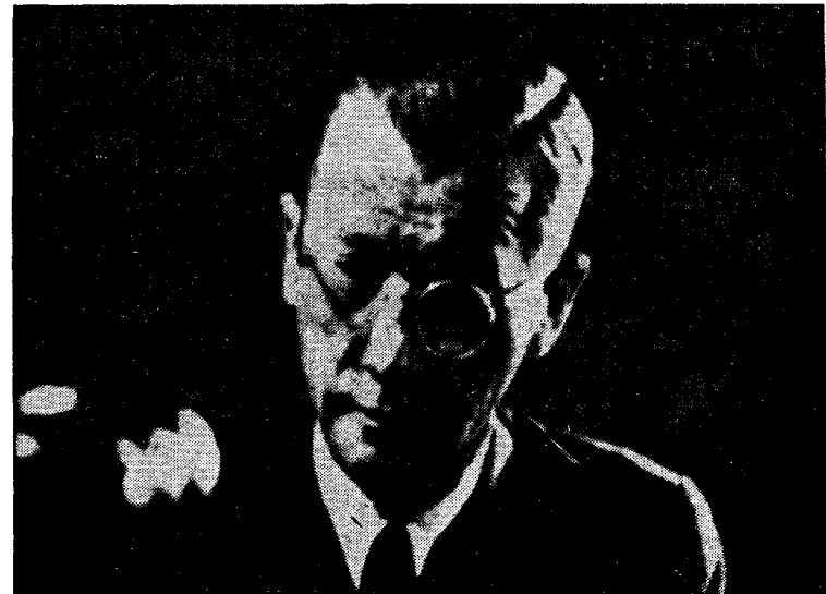
Reichskommissar Terboven kjempet til siste slutt og med alle midler mot Quisling og fikk «gode» hjelpere i bokstavelig forstand

Da sattes igang en voldsom agitasjon om at ingen måtte hjelpe eller ta imot de evakuerte mennesker fra Finnmark. Det var nazistenes sak, for det var de som jaget dem ut. Endel prester var de aller ivrigste i denne hets-