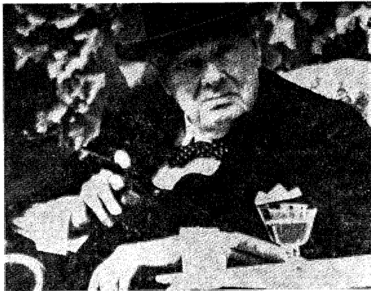
Dette bilde ble tatt i 1964 av den berømte kanadiske fotograf Karsh of Ottawa og viser den aldrende Churchill som grubler over sitt liv og sin innsats.

mentere alle meddelelser han fikk om gode venners bortgang med små sukk om hvorvidt døden i alle tilfeller var en stor velsignelse.