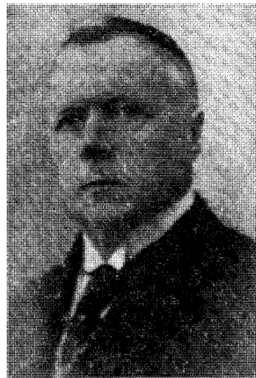
Johan Ludvig Mowinckel: «Vår stilling til Forsvaret var forankret i retten til nøytralitet!»

I tiden etter vårt «opp-gjør» med Sverige i 1905 og fremover mot 1940, ble Norges forsvar redusert og maktstjålet av politiserende nordmenn. Det ble gjort, dels un-