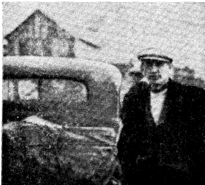
Det statsråd Torp «mobiliserte» var vel nærmest en bil til egen flukt. Og slik var det nok med alle de gamle ridderne av det brukne gevær.