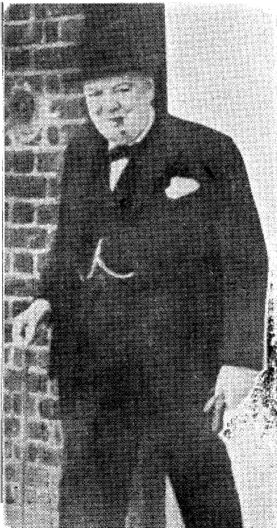
Hans egen fadese i Norge førte Churchill til Downing Street som premierminister. Slik er jo nemlig parlamentarismen.