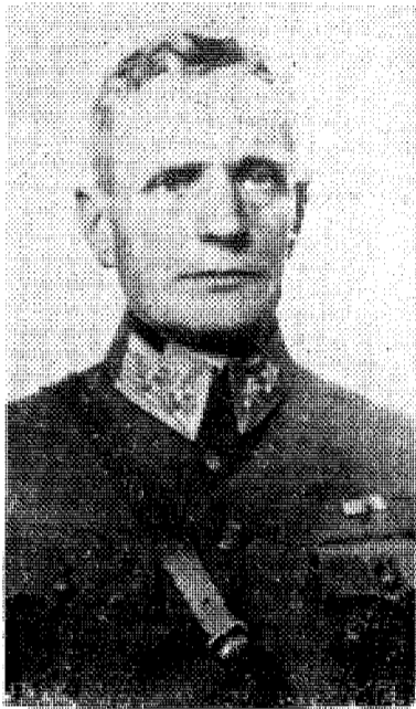
«Noen offisiell ordre om full mobilisering gikk aldri ut», skriver Norges forsvarssjef, general Ruge.

Det regjeringen besluttet etter at det tyske angrep mot Norge var begynt, natten til 9. april, var ene og alene å innkalle noen flere feltbataljoner sørpå. Siden det ikke dreiet seg om en virkelig og alminnelig mobilisering, måtte den da foregå ved innkallelser gjennom posten.