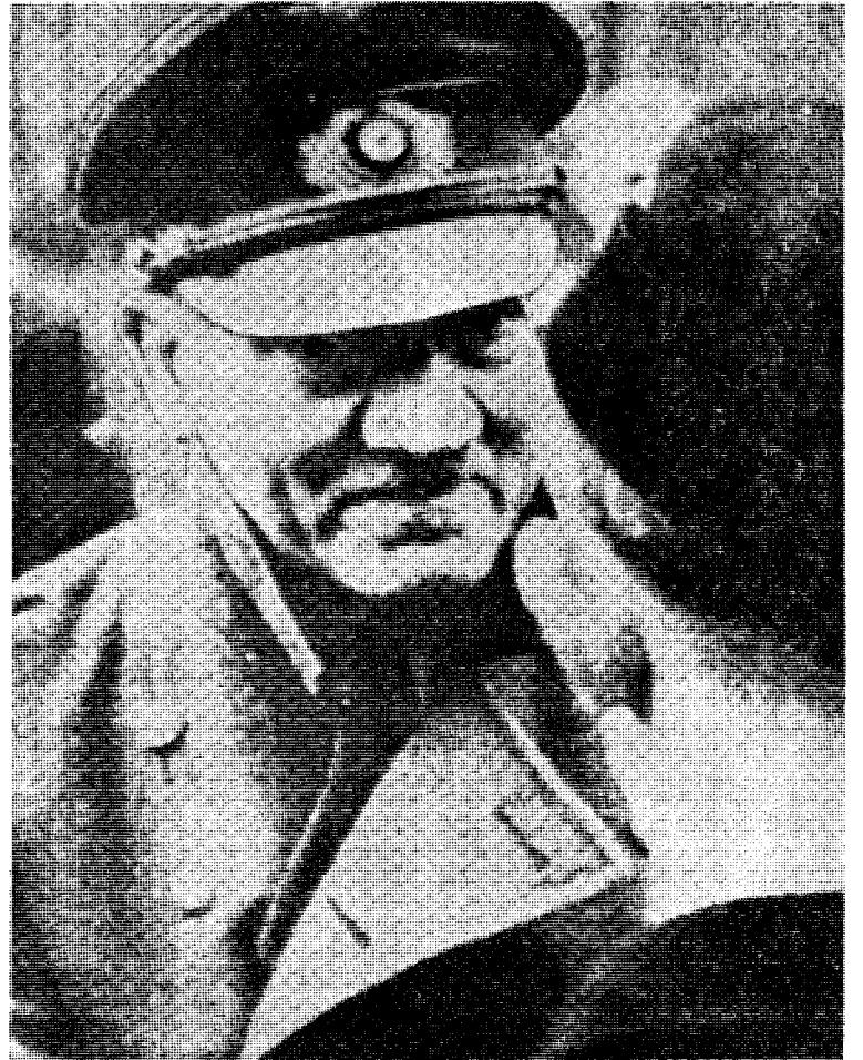
Siste fotografi av Hitler.

Som viste at han så langt fra foraktet sitt folk, slik propagandaen vil ha det til