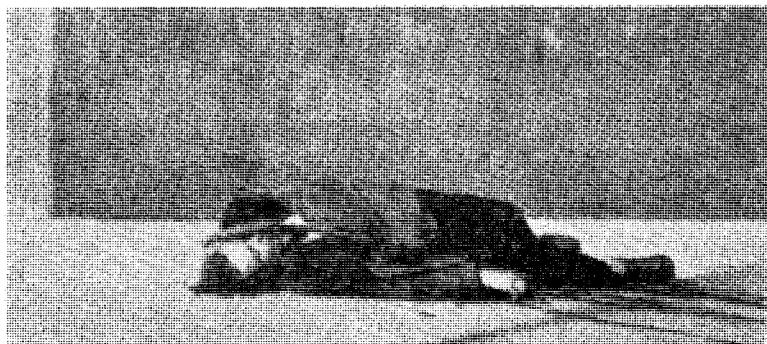
Morderne fant sine ofre — —