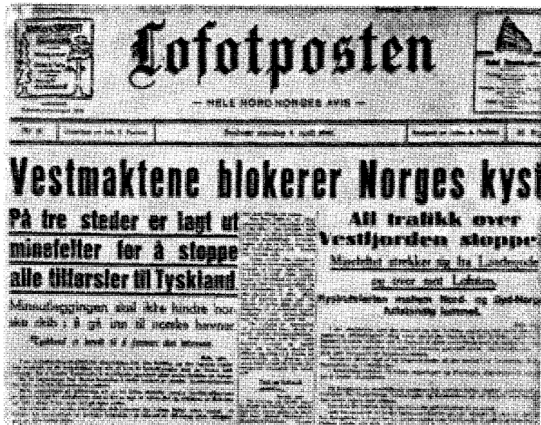
Den britisk-franske aksjon settes igang. «Lofotpostens» oppslag.

Den norske regjeringens forræderi mot nøytraliteten og folket i 1940