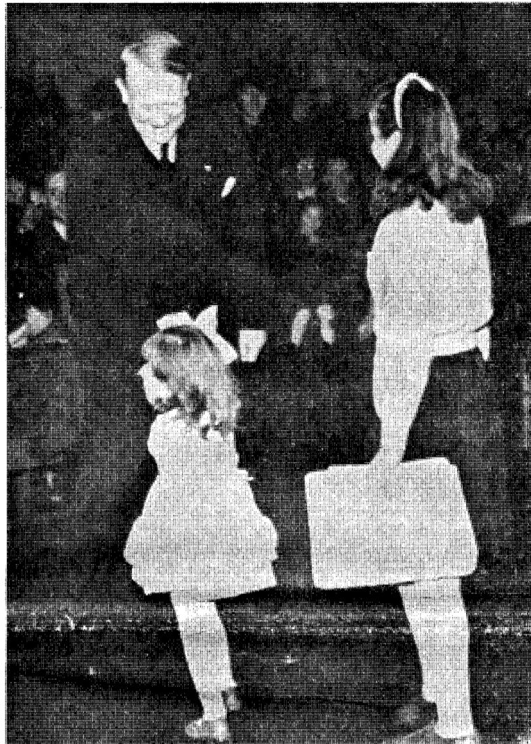
Quisling ville ikke at man skulle bruke religionen i politikens tjeneste.