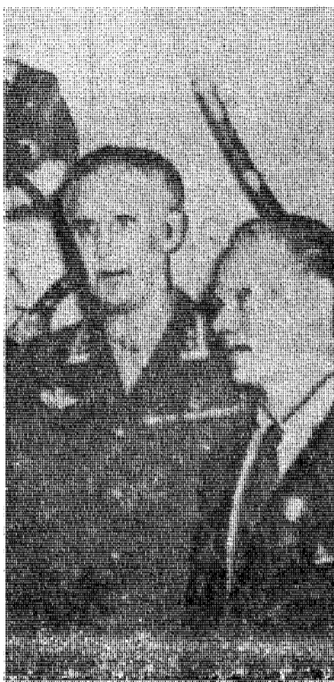
Den svenske leiemorder dekoreres fra norsk side.

Eftersom også Sverige er med i hyklekoret når det gjelder både Hellas og andre lands påståtte umoral, så kan det være på sin plass å minne om boken til den svenske filmskuespiller Christer Strömholm, som vi omtalte her i bladet i jule-numret 1967. Denne Strömholm fortalte i sin bok at han var engasjert som leie-