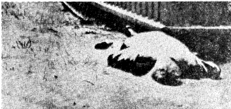
— — — mange steder.