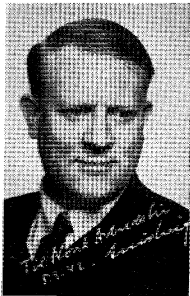
Og da heller ikke skyldig.