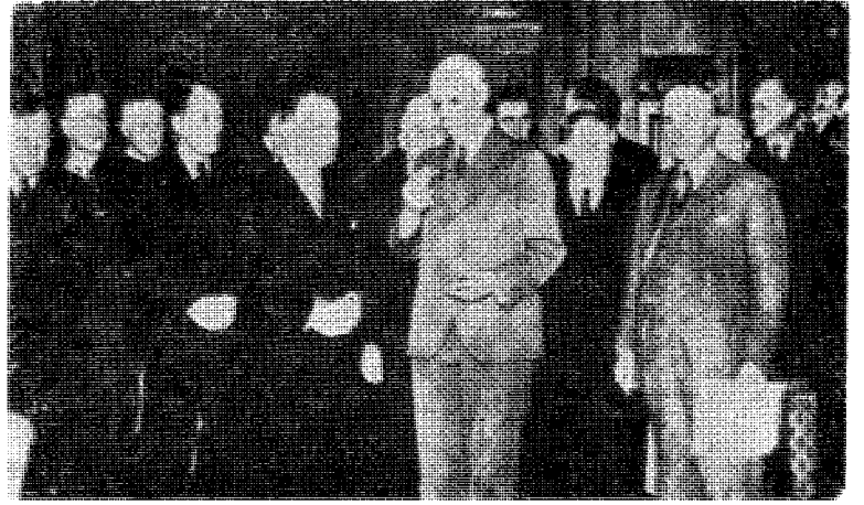
«Ennu har det ikke vært reist noen rettslig aksjon mot Administrasjonsrådet eller dets skapere og størsteparten av deres diskriminerende dokumenter har beleilig forsvunnet.»