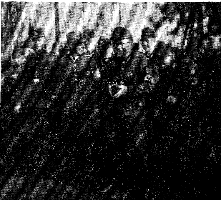
Vi hilser på de norske gjester.