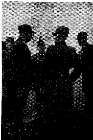
Befalingsmænd i Rigsarbeidstjenesten drøfter dagens arbeide.