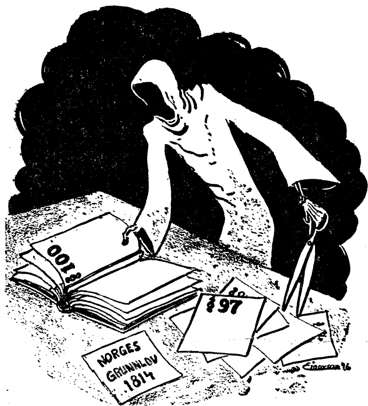
Grunnloven ble betraktet som «a scrap of paper» av herrene i London.