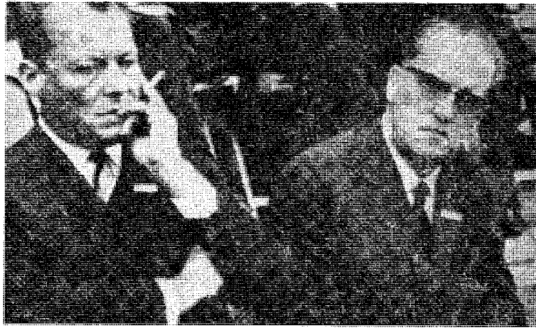
I dag er Wehner i likhet med Willy Brandt (ex Frahm) blitt samfunnsstøtter i en borgerlig verden.

Hvor viktig dette spionasjesentrum Stockholm ble betraktet av stor- og krigsmaktene kunne man forstå bare av den store innsats av ledende personligheter og materiell. MI 5 MI 6 satte inn sine beste folk på samme måte som den amerikanske og den tyske etterretnings-tjeneste. Sovjetrusserne var ellers sterkest engasjert i det nøytrale Sverige.