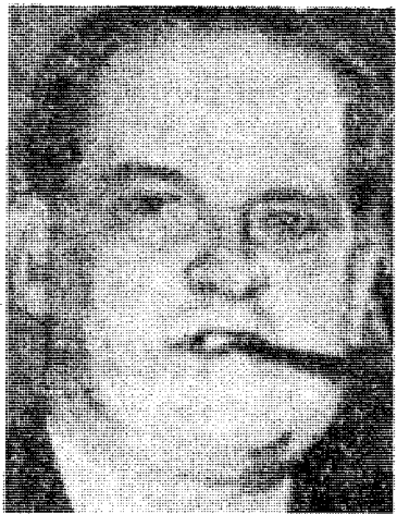
Den tyske minister med den brogede fortid.

Herbert Wehner startet sin politiske karriere som anarkist og var anarkistlederen Erich Mühsams nærmeste medarbeider. I 1926 gikk han imidlertid over til det kommunistiske parti, hvor han gjorde en usedvanlig rask karriere og snart ble