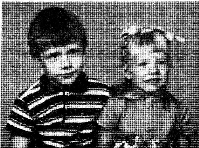
Den svenske «nazileders» barn ser pussig nok både velstelte og veloppdragne ut.