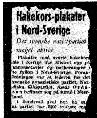
Pressen er rystet — —

For, som han engang sa til forfatteren av denne artikkel, uansett i hvilken form vi organiserer oss, vil vi bli hengt ut som «nazister». Og folk vil tro det når det «står i avisen». Har vi dertil også erklært at vi ikke er det, fra-