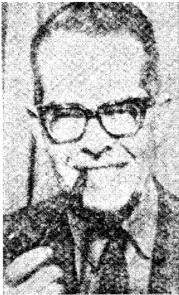
Den allvitende pater.