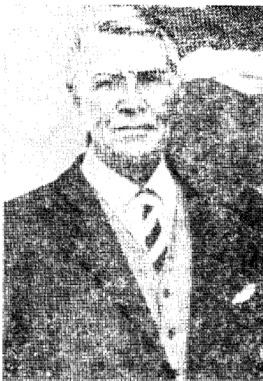
General Arne Dahl minnes.

Russernes innrykning i Norge feires, trass i at den norske forsvarssjefen nordpå i sin tid foreslo å brenne av Øst-Finnmark for å hindre nettopp dette.