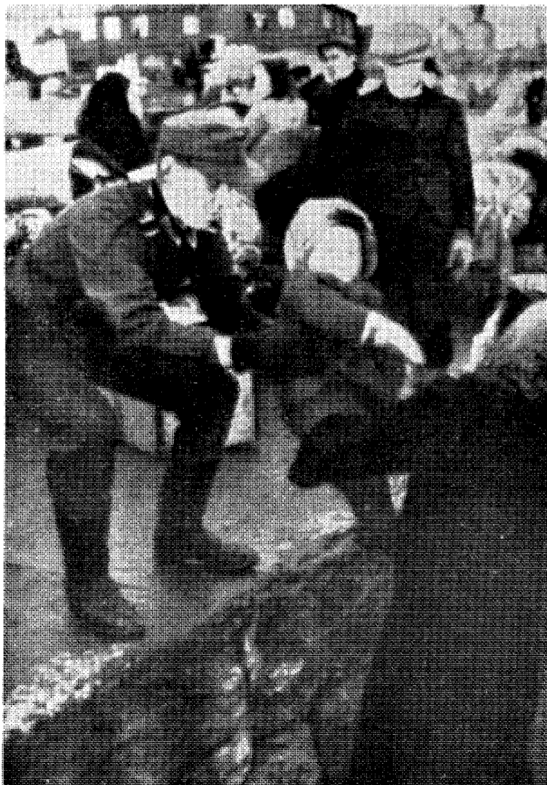
Finnmark evakueres med trusler, tvang og grusomheter fra de tyske soldaters side — slik en ser det her på bildet.