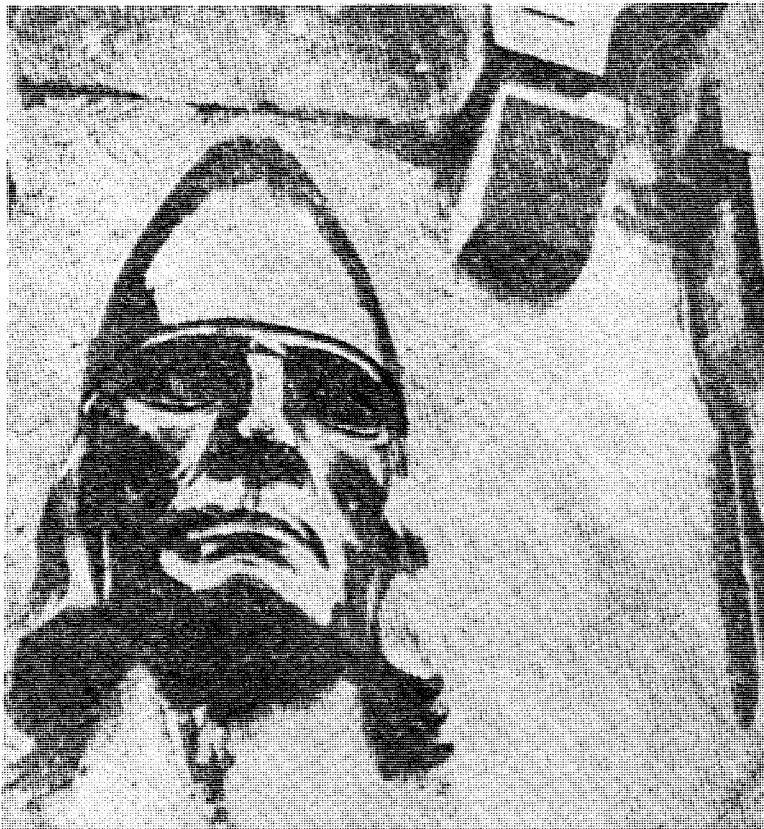
DAGBLADET gjengir et ansikt fra søylen og grasser over hvor «germansk» det er. «Som man ser helt likt med de man finner i tysk og italiensk «kunst» fra fascistens tid.» Ja, er det ikke fælt!