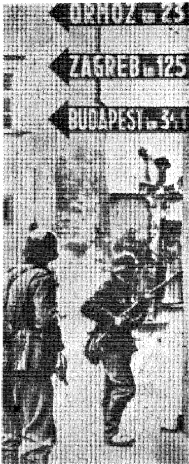
Tyske soldater bekjemper partisaner i Jugoslavia. I vest møtte de senere samme slags motstandere og samme slags ulovlige krigføring som i øst. Det var baggrunnen for det som hendte i Oradour.

Jens Kruuse: SOM VANVIDD. Oradour-sur-Clane 10. juni 1944 og etterpå. Aschehoug.