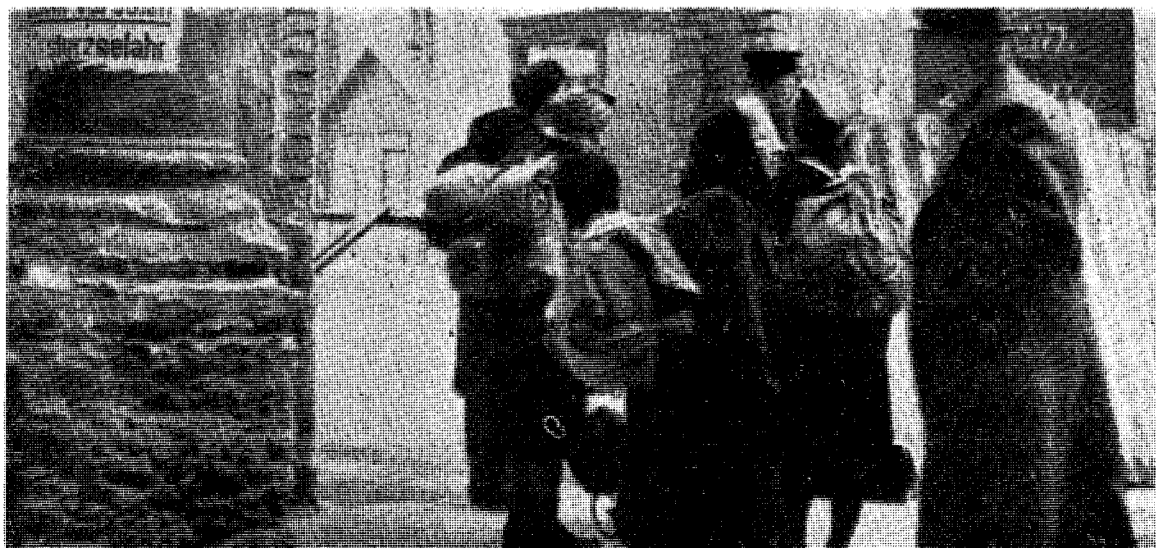
Flyktninger fra øst i verdenskrigens siste fase, som prinsesse Feodora beretter om.