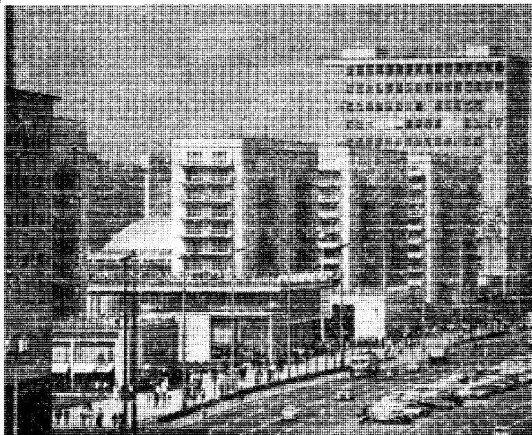
Fra Øst-Berlin idag.