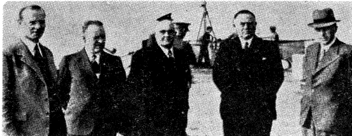
Flukten og «krigsanstrengelsene» endte ombord på et britisk krigsskip som først bragte «styresmaktene» til Tromsø og derefter til England.

«irregulær krigføring» til den virkelige ting. Tyskerne kritiseres faktisk for ikke å ha reist seg mot Hitler og ødelagt nazi-regimet — trass i heroiske anstrengelser av mange enkeltindivider — og ethvert tyskokkupert land har med rette eller urette berømmet sin egen «motstandsbevegelse» overfor verden. Slik «irregulær krigføring» har fått en slags prestisje og blir i stor utstrekning likestillet med «regulær krigføring». Det er et noe innviklet semantisk ar-