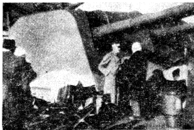
Under britiske kanoner ombord på et britisk krigsskip kunne naturligvis ingen selvstendig regjeringsvirksomhet opprettholdes. Det var da heller ikke rare greiene å opprettholde etter den hodekulse flukten 9. april og de følgende dager av april måned 1940.

12.4. begynte Høyesterett (Paal Berg), statskirken (biskop Berggrav) Oslo Politi (Welhaven) og andre å danne et Administrasjonsråd for det okkuperte Norge, det vil si hele landet fra Narvik og sørover, bortsett fra motstandslommer i Gudbrandsdalen, Trøndelag og Vest-Norge. Administrasjonsrådet overtok kontrollen over det okkuperte Norge 15.4. og gjorde intet for å motvirke den tyske antagelse av at det var en «regjering». Det takket Quisling for hans «patriotisme» og