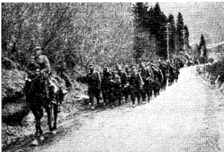
Tyske tropper marsjerer nordover fra Lillehammer etter å ha sprengt Ruges hovedkvarter.