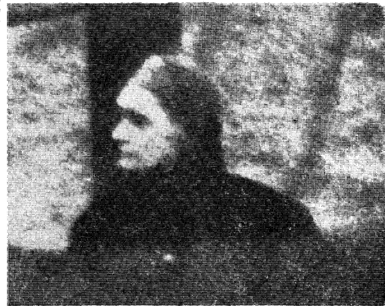
Rudolf Hess fotografert i fengselsgården i Spandau gjennom teletinse.

Fordi han ikke vil fordømme sin døde venn og fører og sin politiske oppfatning.