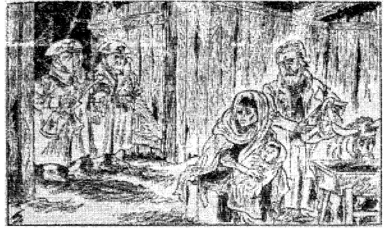
Jul i Betlehem, kunne en vel sette som underskrift på denne tegningen i den tyske NATIONAL-ZEITUNG. Bladet selv setter: «Dere må rømme krybben, hytten skal sprenges.»

Slik opptre man forøvrig i alle de vestlige demokratier, for ikke å snakke om i øst. Ulovlighetene og krigsforbrytelsene fra siste verdenskrig godkjennes uten reservasjoner når det gjelder det en selv sto for. Men det er nettopp de som forherliger den ville og løvløse krig som i siste instans er ansvarlige også for det som nå hender i Vietnam, og som vil komme til å hende overalt hvor krig bryter ut. Også i det ulykksalige Norge som overfor en eventuell motstander tydelig har gitt tilkjenne hvorledes en ønsker en krig drevet og sin sivilbefolkning behandlet: Slik som i Vietnam.