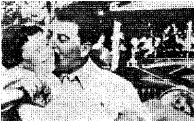
Stalin og hans datter levde et skjermet luksusliv bak Kremls murer og på landssteder. De var såvisst ingen proletarer.

Skal NS-folk ha skylden for Hitlers gjerninger, så bør vel jøssingene også ha ansvaret for Stalins.