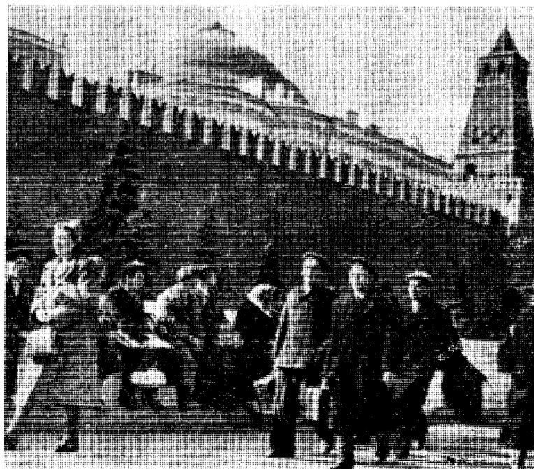
Utenfor Kremls murer gikk den vanlige befolkning som hadde ganske andre kår og som i Stalins tid gikk i en evig skrekk for det hemmelige politi.

Og slik beskriver datteren forholdene som jøssingene (Forts. side 7)