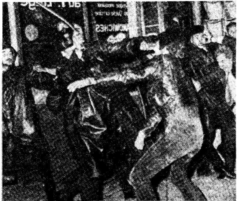
Studenturoligheter i Paris.