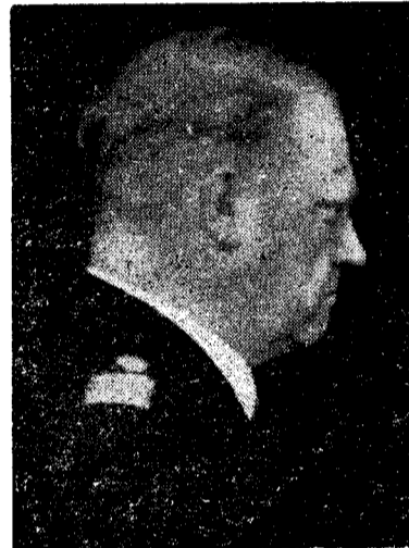
Quisling hadde visjoner om Europas fremtid også i sin bok av 1950 «Russland og Vi». Den er utgangspunktet for vår danske venns analysering av dagens situasjon.

Fra en av våre danske venner har vi mottatt etterfølgende artikkel om Vesterlandets gjenfødelse. Han tar sitt utgangspunkt i Vidkun Quislings bok «Russland og Vi» og selv om nok enkelte kan være uenige i hans syn på utviklingen, så er det iallfall interessante betraktninger han kommer med.