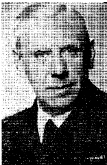
Selveste admiral Canaris oppsøkte Raeder og redegjorde for de britiske angrepsplaner som Abwehr var oversvømmet av meldinger om.

Vestmaktene ville besette et mindre antall punkter på Norges