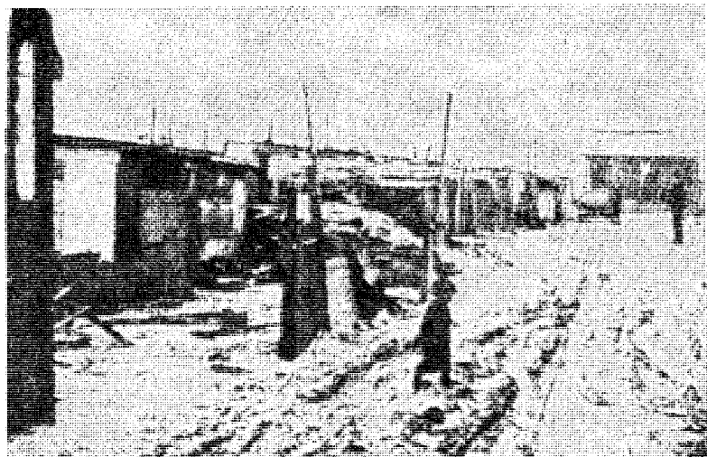
Slik ser det ut i en bidonville — —