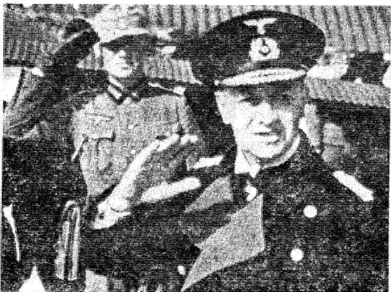
Admiral Raeder forklarte seg inngående om de britiske angrepsplaner mot Norge og de motiltak han så seg tvungen til å foreslå. Intet eller lite av dette fikk offentligheten vite.

Nå foreligger det endelig en bok om det seierherrenes Nürnbergdomstol ikke slapp frem for offentligheten.