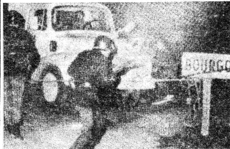
Kamp mellom politi og demonstrerende småkjøpmenn ved Bourgoine.

30 prosent av pariserstudentene er nyfascister — nypoujadister plyndrer skattekontorene — OAS-bander røver banker og 3 mill. fargede fremmedarbeidere skaper raseproblemer.