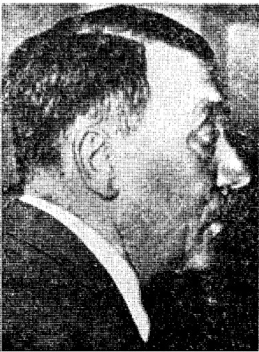
Resultatet av dr. Morells behandling: Hitler i full legemlig oppløsning i 1945.

Hitler trodde at han tok inn livsviktige vitaminer, men ble altså etterhvert faktisk dirigert av sin livlege når det gjaldt sinnsstemning og opptreden, noe som igjen influerte på hans avgjørelser. Først i 1942/43 oppdaget man innholdet av de tabletter Morell gav Hitler, men forsøket på å komme livlegen tillivs via Reichsführer-SS Himmler mislykkedes. Morell ble dekket av Hitler som trodde blindt på ham og av den mann som det også på andre måter har vært reist slik tvil om, den mektige Martin Bormann, som alltid støttet Morell. Forsøket på å la Morell forsvinne