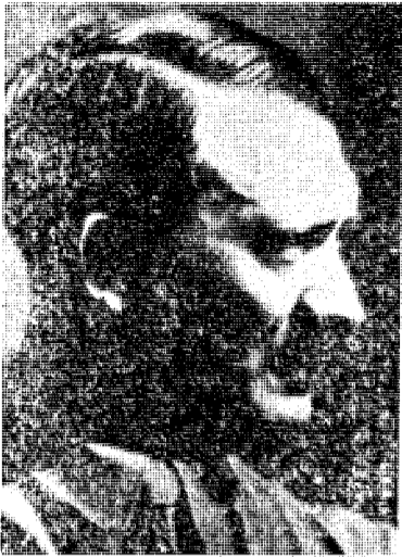
Adolf Hitler i 1934, full av ungdommelig spennkraft.

Nye opplysninger i en artikkel av dr. Fikentscher i «Die deutsche Nation»