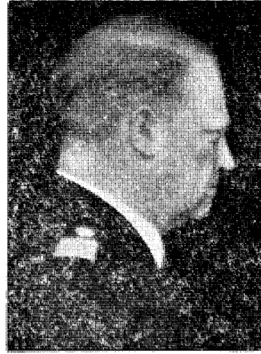
Naturligvis ingen forræder!

grunner til at Quisling ikke kan betegnes som forræder.