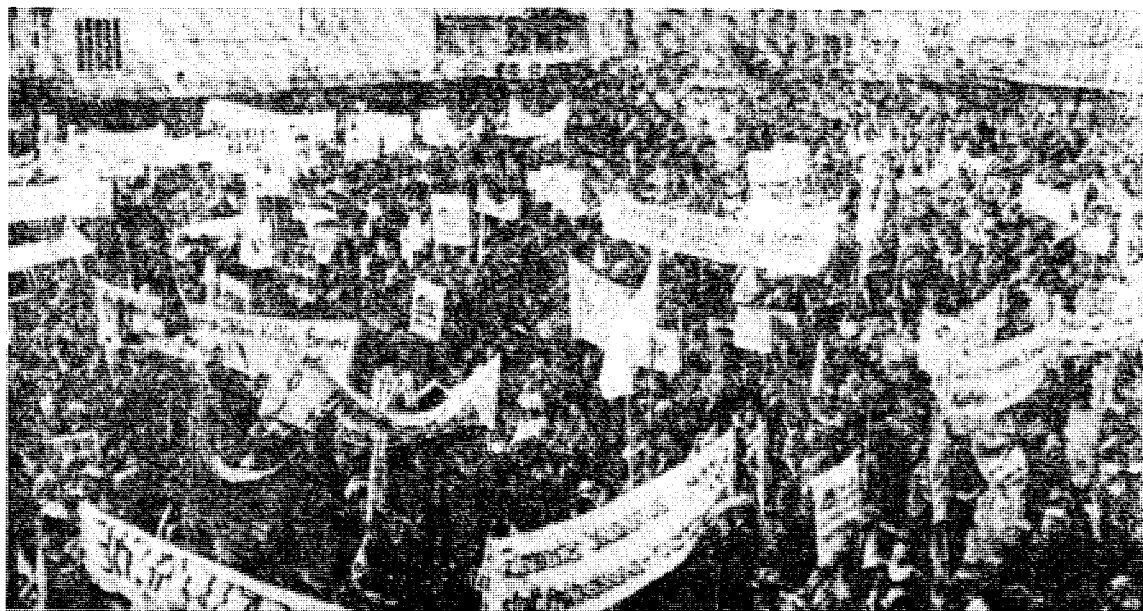
I motsetning til norske aviser syntes POLITIKEN dette var omtale verd.