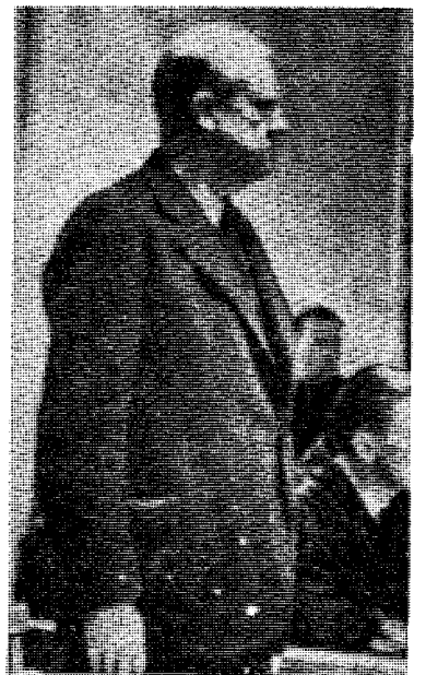
Mannen som ble dømt for å ha villet sikre Norge en viktig plass i en europeisk samling, for å «bevirke eller medvirke til, at Norge eller nogen Del af Riget bringes under fremmed Herredømme» som det het da det gjaldt Quisling og et EF.

Saken er jo den at Quisling i en rekke taler under okkupasjonen kom nærmere inn på karakteren av den samling han tenkte seg og som jo opprinnelig, før annen verdenskrig, tok sikte på en germansk samling omkring aksene London—Berlin. Da utviklingen gjorde dette umulig, forsøkte han å gjøre det beste ut av det gjennom å arbeide for en samling omkring det germanske Tyskland. Men, hele tiden så han på Norge som noe av en hjørnestein i det Europa han