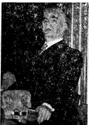
Koht var en mangfoldig herremann, men han var på sett og vis mere sannhetskjærlig enn sine kolleger.

I flere år har disse våre kjære offentlige Mænd sett tiltyknende skyer over riket. De forstår at affærene ikke lengre kan hoppe og gå med