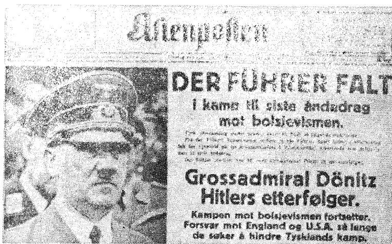
Da Adolf Hitler døde gråt bladet en skvett, men naturligvis det også «nødt og tvungent» som det nå heter.