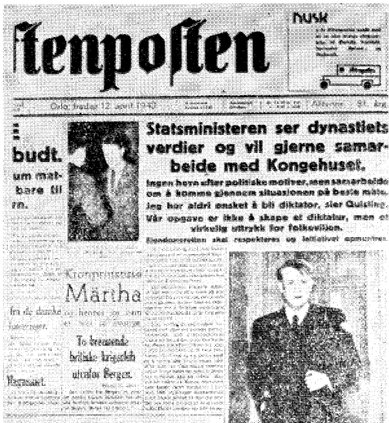
Aftenposten var stans på pletten med uønsket omtale av «statsminister Quisling». Men det får vi neppe bære noe om i TV.

Fjernsynet og Forsvaret (!) skal nå forherlige pressen fra dengang, men naturligvis bare den illegale og etterpatriotene