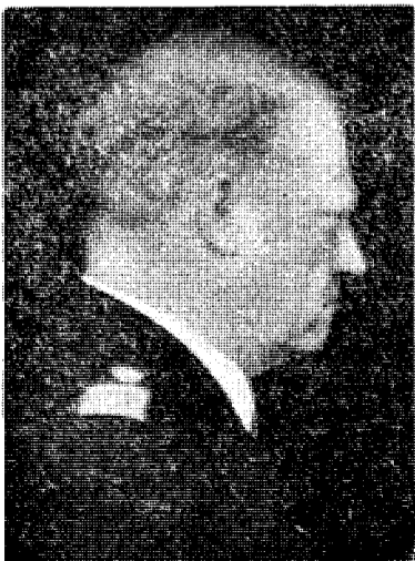
*) På omslaget er det et bilde av Mannen som verden aldri blir ferdig med.

*) Mislykket opprører mot James II av England i 1685.