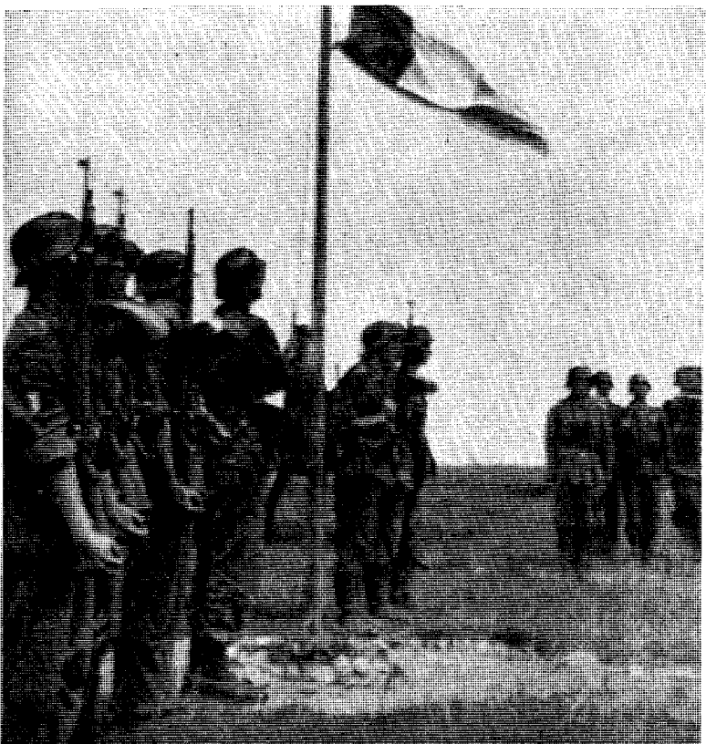
Franske frivillige gjorde en stor innsats på tysk side på østfronten.