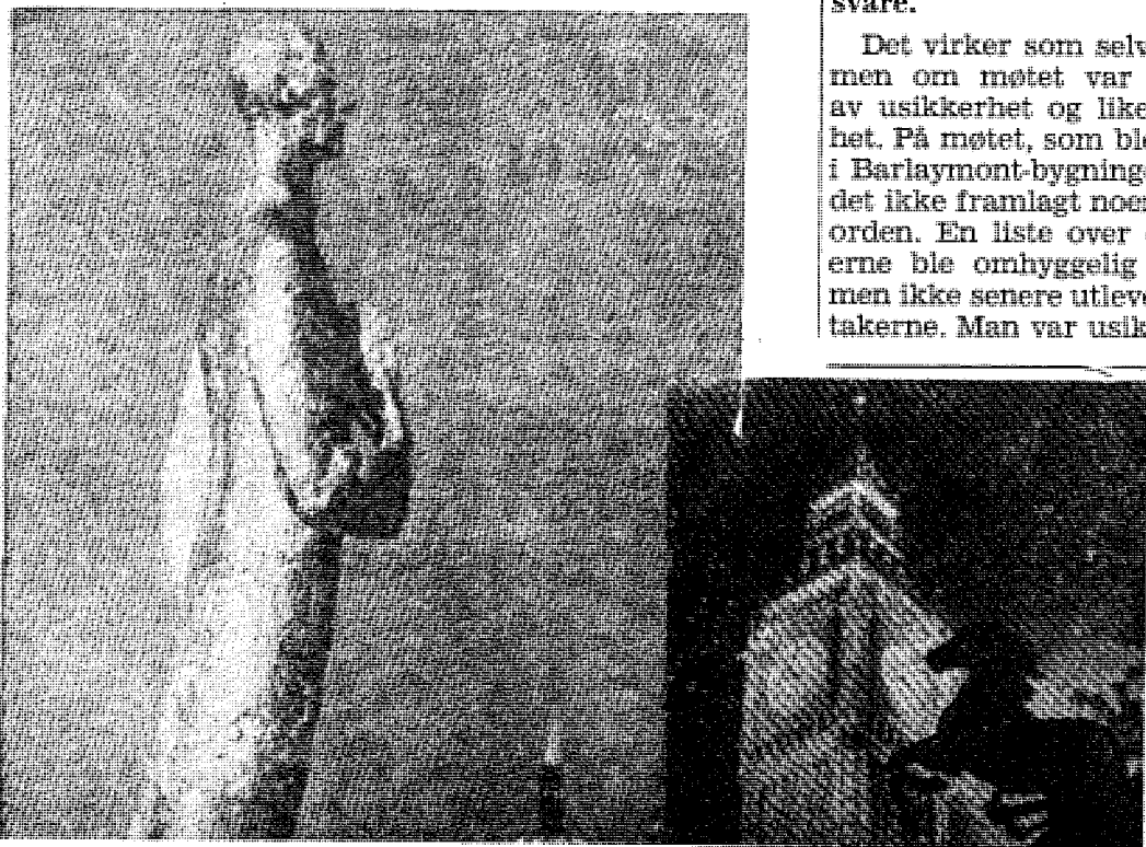
Er det noe symbolsk i kongebautaens lange bals? spør Siegfried? Speider kongen over hav mot England?

«Sverige har bare 1/7 av vår befolkning. Landet kunne lett gi plass for et stort antall ugandiske asiater. — Svenskene har snakket om likhet. La dem nå vise at det ikke bare er prat,» skriver avisen.