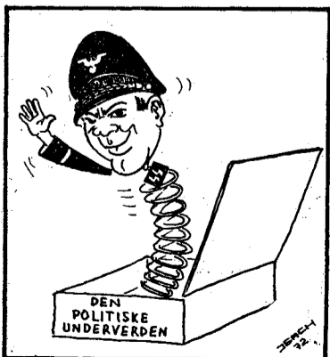
Dekadensens mareritt eller ånden som går.

Rapport fra Demokratiet: Det ser ut for at «vi vil ha et sted å være»-ungdommen fremdeles mangler noe å ta seg til. I pakt med frisk og kjekk ungdoms virketrang ser det forøvrig ut for at de likevel har klart å finne seg en hobby. Det siste på det