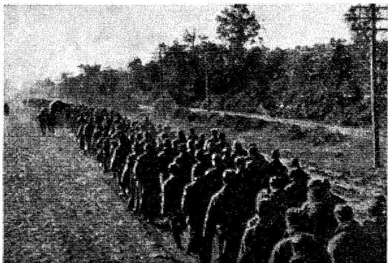
Tyskernes behandling av østfolkene er ett av ankepunktene mot Hitlers Tyskland. Russiske fanger. 1 million av dem meldte seg til kamp mot Stalinstyret, men slapp ikke til