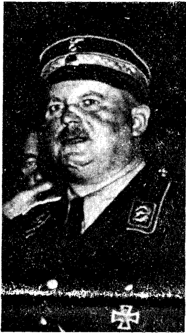
Den blodige aksjonen mot ledelsen av SA, med Röhm i spissen, var et angrep på sosialismen innen partiet. Röhm ble såret i ansiktet under 1. verdenskrig og temmelig vansiret.

Fra en ung nasjonalist har vi fått etterfølgende artikkel som vi trykker med så meget større glede som den dekker redaksjonens oppfatning når det gjelder synet på den tyske nasjonalsosialisme.