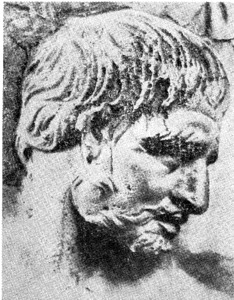
Hode av en germaner på Trajansøylen i Roma