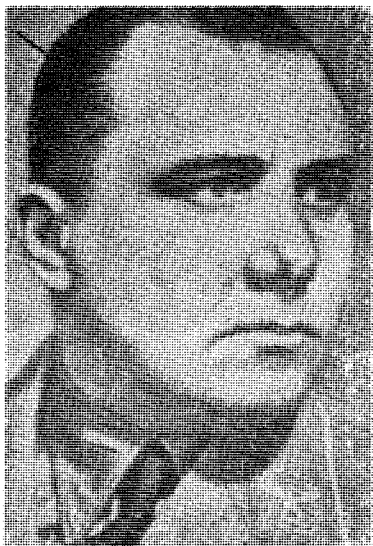
Gåten Martin Bormann

Nye sitater m.v. til belysning av Hitlers mystiske fortrolige fra krigsårene