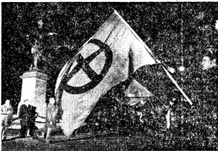
Med solkorsfanen hyllades konung Karl XII.

DAGENS NYHETER bragte dette bilde som viser Nordiska Rikspartiets store solkorsfane under byldningen av Karl XII i Stockholm 30/11 sistl.