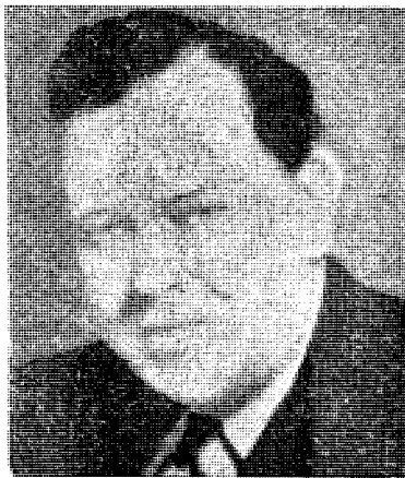
Trygve Lie forhandlet som eksilminister med Sovjet om prisgivelse av Svalbard.

Når det er så trykkende taust fremdeles om de manipulasjoner man under annen verdenskrig og kort etter foretok med den del av riket som heter Svalbard, så er forklaringen naturligvis den at det rammes av straffelovens paragraf 83, den samme som man anvendte i saken mot Vidkun Quisling på et forøvrig meget tvilsomt grunnlag. Straffelovens § 83 setter som kjent straff for den som rettsstridig søker å bevirke eller medvirke til at Nor-