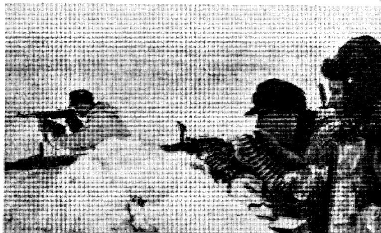
Norske legionærer i skyttergraven på Leningradfronten