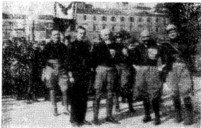
Marsjen mot Roma.

Ja, jeg må stikke nå. Du forstår, jeg har tatt meg en ekstra-jobb for å gjøre det litt lettere for deg og alle de fremmede fuglene du tar under dine vinger, kjære «hømemor». Nei, ikke bli rørt — og ikke takk! Det er bare min simple plikt mot Dine medmennesker, kjære Demokrati! Ha det!