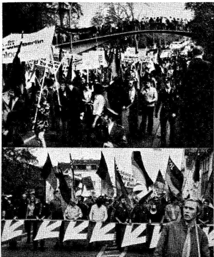
Fra demonstrasjonene mot østtaltene i Bonn sist mai. Som man ser er det ungdommelige innslag markant.