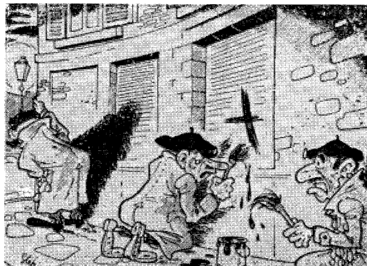
«Nasjonalismen» får bare reklame når en eller annen minusvariant har klint bakekors på gatehjørnene, skriver vår medarbeider.