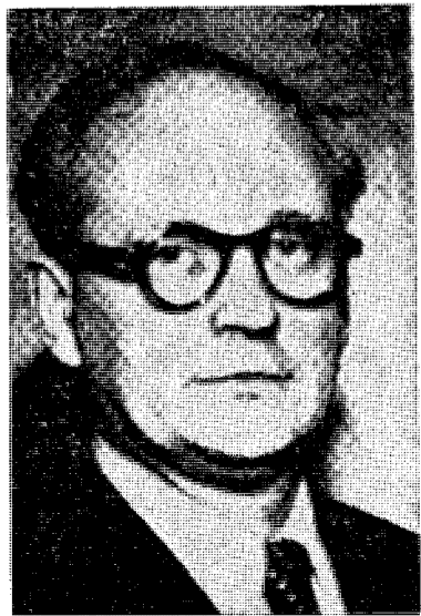
Utenriksminister Hallvard Lange