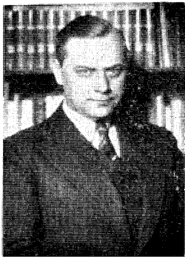
Alfred Rosenberg var en fantastisk berre.