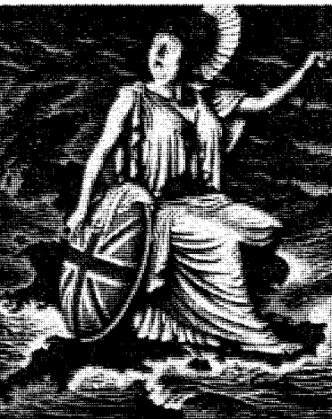
We trust in England!

Nei, men polske menn fikk slåss for England så lenge krigen varte, og Tyskland og Sovjet delte Polen mellom seg.