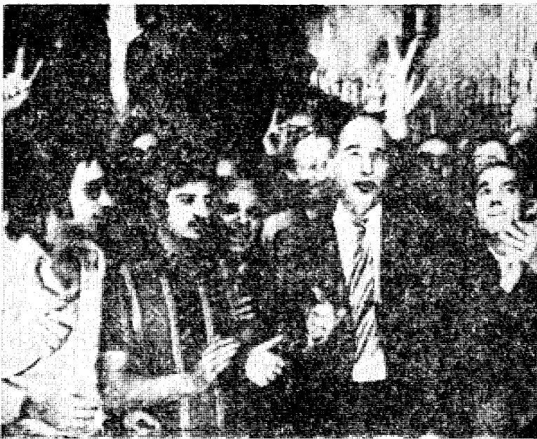
Almirante har forblitt sin ungdoms idealer tro. Han fulgte Mussolini til det siste og leder nå den ny-fascistiske bevegelse.

I motsetning til norsk dagspresse, later den danske til å være adskillig opptatt av nyfascistenes fremmarsj i Italia og drøfter bekymret utsiktene for det parlamentsvalg som skal holdes i mai. En av disse danske aviser er WEEKENDAVISEN, som i en stor artikkel 10. mars drøfter «Fascismens chanser» og i overskriften spør: «Kan det ny-fascistiske MSI velte koalisjonspartiernes flertall i deputeretkammeret?» Artikkelen er forbausende objektiv på bakgrunn av norsk presses behandling av slike emner og vi gjengir den derfor i sin helhet i norsk språkdrakt: