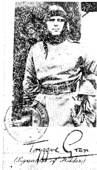
Tryggve Gran som britisk flyver i første verdenskrig.

må utstå denne gang, men kommer igjen i neste nummer. Imidlertid bringer vi meget annet godt stoff. På side 4 finner man som vanlig spesialstoff for ungdommen. Lederen beskjeftiger seg med hetsen i forbindelse med det greske militærstyres jubileum, og i den faste artikkel «I brennpunktet» ser vi litt på hva som egentlig kan hende om Vest-Tyskland ikke ratifiserer ostavtalene. Det siste har sin interesse selvom ratifikasjon allerede nå skulle være vedtatt. Se sidene 2 og 3.