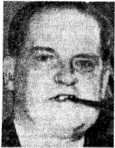
Herbert Wehner — durkdreven i politisk slalåm.

For enhver overbevist kommunist var imidlertid Wehner en død mann — helt til man begynte å få øynene opp for at den forstøtte like-