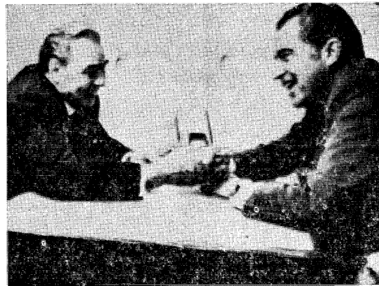
— That's a deal! De smiler så tillitsfullt de to, Bresjnev og Nixon, og vet ikke ennu hvem som blir «svarteper».

får et militært og økonomisk sett stadig sterkere Sovjet, driver Vesten en materiell og åndelig «nedtrapping» av sine væpnede styrker, det gir statsstøtte til politiske