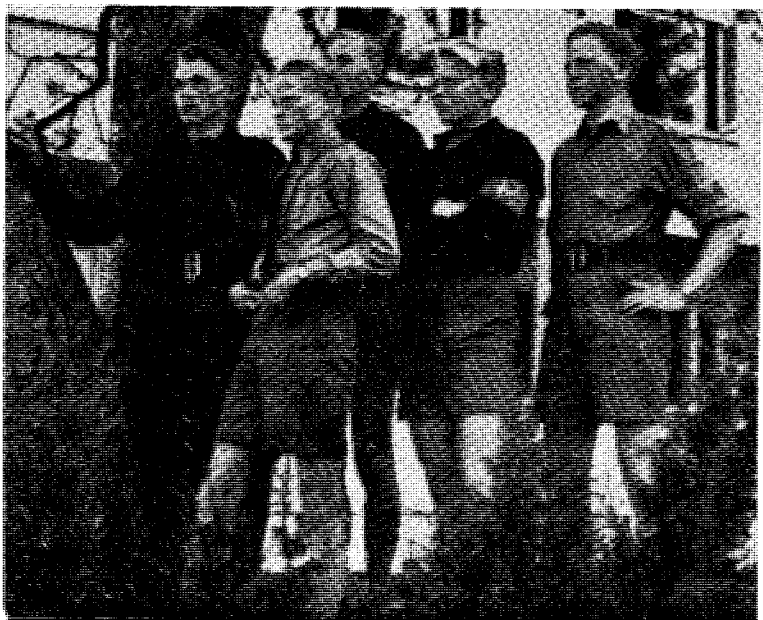
Norske ungnasjonalister — anno dazumal.