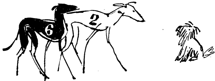
— Det er den pussige fyren som påstår at alle raser er like.