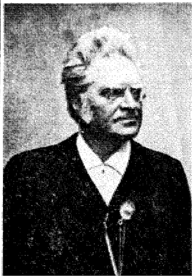
Dikterhøvdingen Bjørnstjerne Bjørnson mente også at Frimureriet hadde en avgjørende innflytelse på norsk politikk.

Det har alltid fra nasjonalt hold vært næret interesse og mistenksomhet overfor det