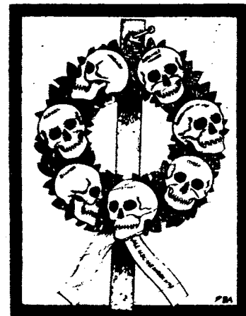
Svært få gjennomskuer det farligste ved sosialismens falske, men besnærende likhets-tese.

Svært få gjennomskuer det som er aller farligst ved denne falske, men besnærende tese: Hvis det nemlig er så at vi alle bærer i oss nøyaktig de samme evner og muligheter, da er ingen av oss uunnværlige, og vi kan alle uten vanskelighet erstattes av andre. Det er denne likhetstanke som er selve grunnårsaken til de kommunistiske lederes menneskeforakt og mangel på respekt for menneskeliv. Hva spiller det for en rolle at man utrydder noen timillioner mennesker når det finnes nok av