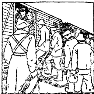
Fri reise ..