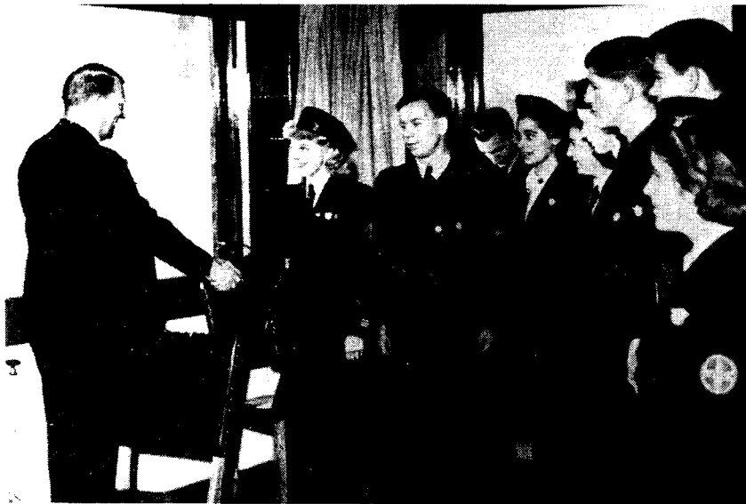
En smilende og blid Quisling mottar en delegasjon av NSUF-ledere som nettopp har vært på studietur hos Hitler-Jugend i Tyskland. November 1940.