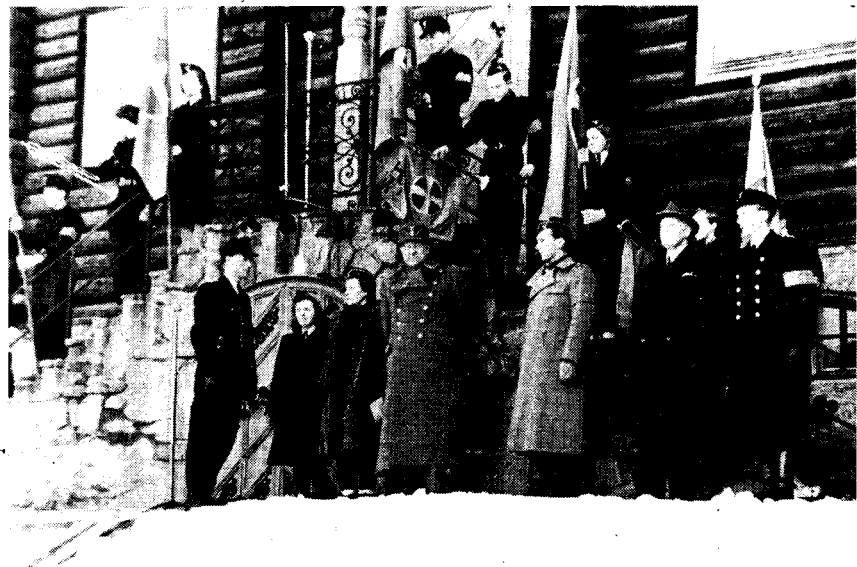
Quisling gjester Ungdommens Vinterleker på Frognerseteren. Vinteren 1943-44.