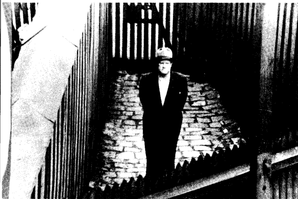
Quisling i luftegården på Akershus.

Det er rart, dette med øyne som ser . . . eller leser.