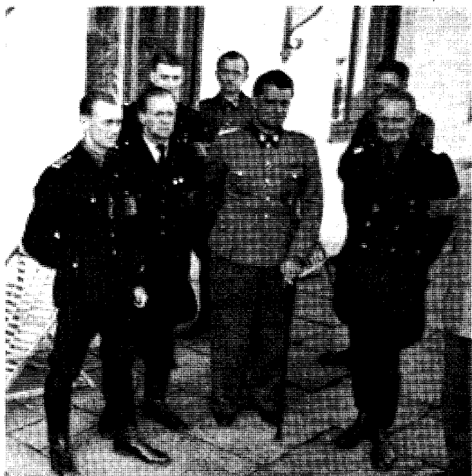
I sitt arbeide for å fremme Quislings Europa-politikk besøkte NSUF-ledere også ledelsen for Waffen-SS Junkerschule Bad Tölz. Til høyre NS ungdomsfører, minister Axel Stang.

Vi som i sin tid stemte imot tilslutning til Romatraktaten, og dermed imot fellesmarkedet, er ikke av dem som er imot et (Forts. side 6)