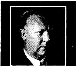
VIDKUN QUISLINGS FORSVARSTALE i lagmannsretten september 1945