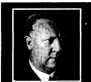
VIDKUN QUISLINGS FORSVARSTALE i lagmannsretten september 1945

PRAKTUTGAVEN: Pris kr. 300,- inkl. tre eks. av billigutgaven.