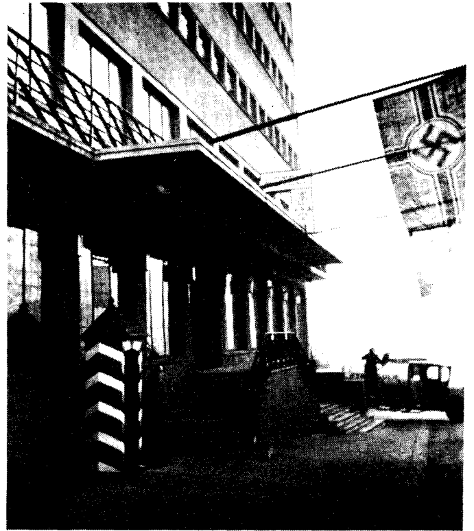
Den tyske overkommando hadde forhåndsbestilt rom på KNA-hotellet.

— I så fall skjulte de det godt. Atmosfæren var mer preget av spenning og uvisshet enn fiendtlighet mot oss. Flere uttrykte imidlertid stor misnøye med at kongen og regjeringen var flyktet fra hovedstaden og at politi-