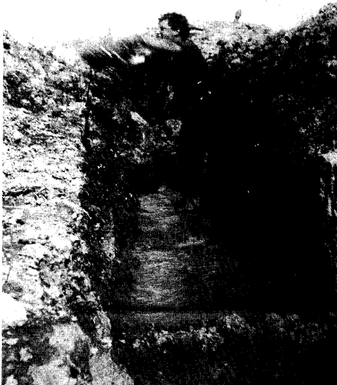
Vårløsning. Skyttergraven øses med vaskevannsfat.

Da legionen var ferdig utdannet omkring nyttår 1941/42, ble den transportert pr. jernbane fra Fallingsbostel til Stettin, for derfra å skulle sendes videre med båt til Finland. Selve innsatsstedet ble ikke gjort kjent for legionærene, med det den tyske hærledelse hadde i tankene var nok Louhifronten, dvs. avsnittet hvor de senere norske enheter, Skijegerkompaniet, Skijegerbataljonen og politikompaniene (med unntakelse av det 1.) ble satt inn. Dette fordi det var det eneste sted på finskefronten hvor det befant seg en divisjon av Waffen-SS, den 6. eller såkalte «Division Nord».