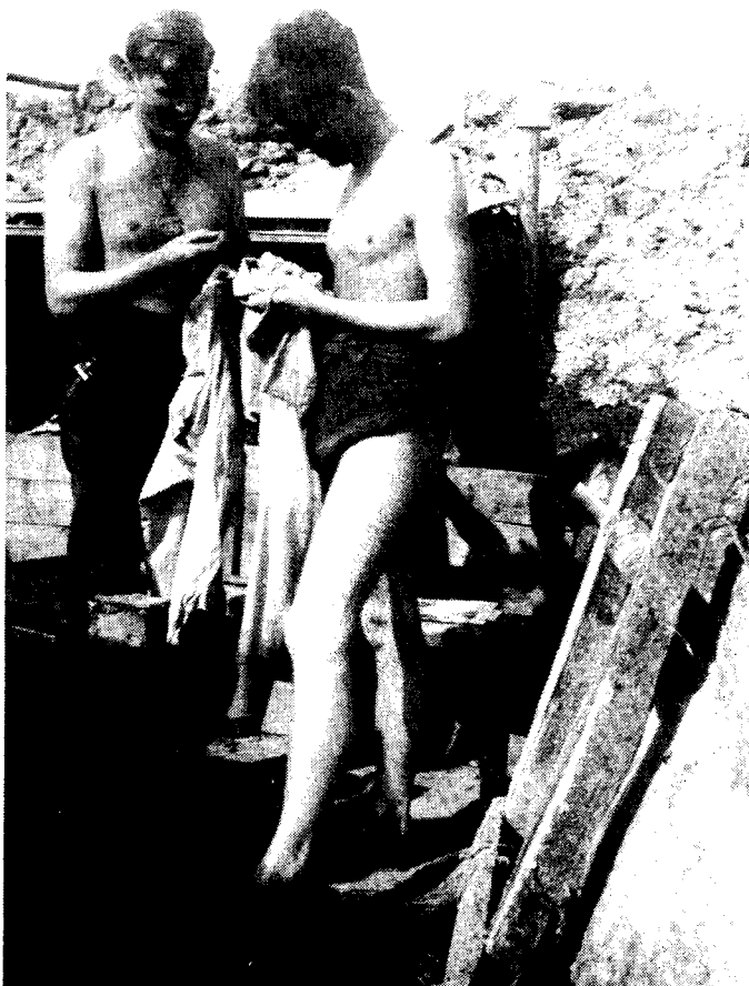
En godværsdag i skyttergravene. Den daglige lusejakt.

Forsyningstjenesten fungerte stort sett bra, men legionærene led mye vondt. Særlig ille var luseplagen. Livet i skyttergravene tillot ikke noen større hygiene, så de aller fleste fikk lus. De som var heldige å kunne bo i hus (avdelinger som tilhørte trenet) hadde det noe bedre, men der var - det vanlig med veggdyr (Wanzen), som kunne være meget plagsomme om natten.