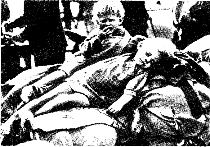
Noen har forbarmet seg over disse foreldreløse barna og tatt dem med på en håndkjerre for å finne et barnehjem som kan ta seg av dem.

Mens historieskrivingen i Norge når det gjelder forholdene omkring den annen verdenskrig, fortsatt er temmelig ensidig preget av seierherrenes moraliserende syn, er dette forhold i ferd med å bli kraftig forandret på kontinentet. Når jeg snakker om en moraliserende historieskriving i Norge i denne forbindelse, er det fordi alle offisielle fremstillinger (historiebøkene i skolene f.eks.) går ut på at de tyske tapere representerte kun diktatur og ondskap mens de allierte seierherrer stod for demokrati, frihet og rettferdighet.