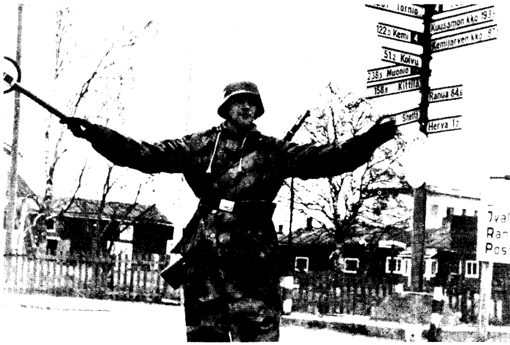
En norsk frivillig i Finland i krigens slutfase.

At vi var rekonvalesenter ble snart glemt, og vi ble innlemmet