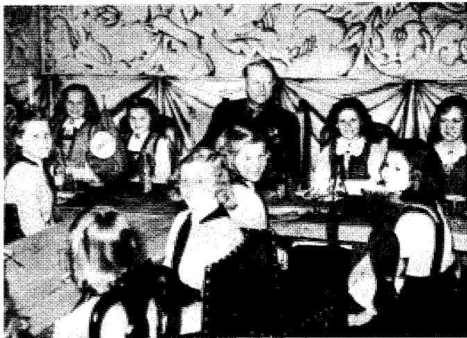
Tabubelagt barndom. Hvor lenge?

Jeg ser i FOLK OG LAND nr. 2 1989 at et NS-barn oppfordrer: «NS-barn i alle leire foren dere!» Da kan det bli taperens etterfølgere akkurat som seierherrenes etterfølgere har drevet på i mange år. Med et norsk «glasnost/perestroika» må det vel også bli plass for tidligere NS? Apropos NS og forhold dermed forbundet: jeg har lenge forundret meg over at dette med NS behøver å være så tabulagt som det må sies å ha vært. F.eks. har jeg aldri hørt ett eneste menneske si: «Jeg var medlem av NS». Selv ikke da vår familie leiet hus hos en NS-familie fra 1941 og helt til 1960. Det var en enke f. 1866, sønn f. 1902, datter f. 1904. De to barna var i Hirden mens moren nøyde seg med å bære solkorset på kåpe-slaget, de hadde vært medlem-