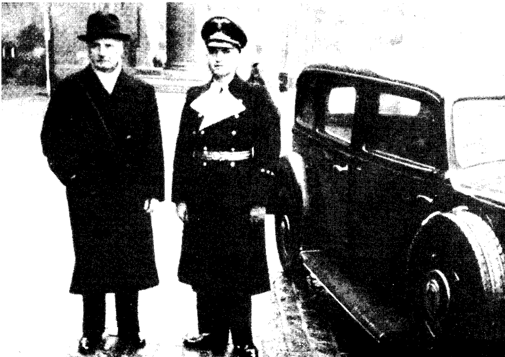
Statsminister Scavenius i samtale med dr. Werner Best under okkupasjonen.

Best hevder at Quisling konsekvent arbeidet for å sikre Norge en fri selvstendig stilling i Europa og at Terboven måtte bli avsatt og rikskommisariatet opphevet: «Det er klart at Quisling og hans medarbeidere visste om det spente forholdet mellom Terboven og meg, og Quisling dro den konklusjon at han burde søke nærmere kontakt med meg. Hver gang han reiste (Forts. side 6)