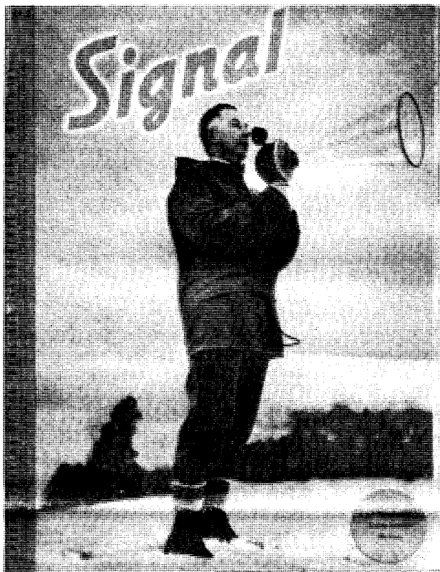
Berggrav kaller – til våpenedleggelse. Nordmarka, april 1940.