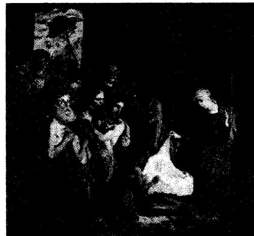
Altertavle i Jacob kirke

Hvorfor ble Gud også menneske? Slik spør en vel kjent middelaldersteolog i tittelen på et av sine hovedverker. Hvorfor ble Gud også menneske? Generelt kan det svares med Hebrerbrevets ord, «Guds sønn er avglansen av Guds herlighet og avbilledet av Guds vesen.» Jesus sier om seg selv: «Jeg er veien, sannheten og livet.» Han er veien til Gud. Han er sannheten om Gud og han er livet i troens samfunn med Gud.