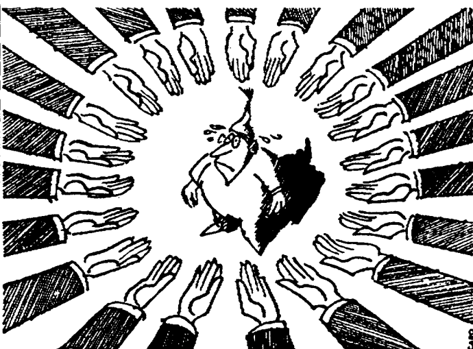
Den tyske Michel: «Jeg har bare venner!» Fra «Welt am Sonntag».