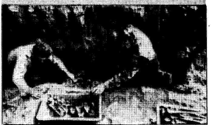
MASSEGRAV: Arbeidere endokker skjeletter i en 11 meter dyp tidligere skyttergrav som ble brukt av den tyske nazihær.