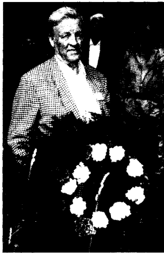
E. Saxlund ved kransenedlegging på gravstedet til Den norske legion.

De norske frontkjemperne besøkte også den tidligere krigskirkegården i Krasnoje Selo. Det vesle gravstedet ble slettet etter krigen, men veteranene fant spor etter den gamle kirkegården der 154 frontkjemper - og mange tyskere - ble begravet.