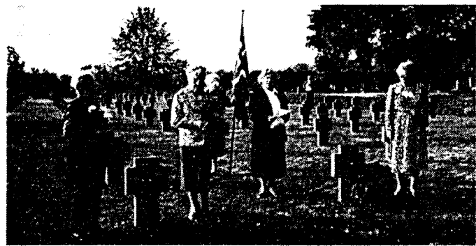
Fra minnehøytideligheten ved "Søstergravene" i Wien 25. sept. i 1994.

Vi henstiller til dem som også i år tar turen til Østerrike om å avse en stille stund ved disse gravene.