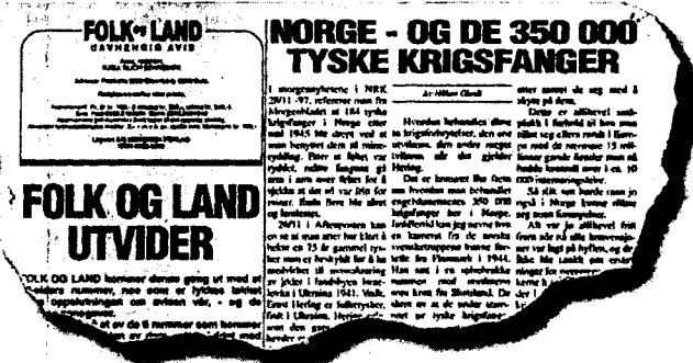
INTERESSEKONFLIKT: Vi har en opplagt interessekonflikt. Våre foreldres organisasjon INO og deres avis Folk og Land arbeider med å gjøre motivene for deres ideologiske valg kjent for almenheten, skriver artikkelforfatteren.

ønsker å kyle verdenshistoriens største krigsnederlag i fanget på andre. Møtene de snakker om, er i virkeligheten livsfarlige feller. De aner det nok når de kaller møtene for «vennetreff», uskyldigst møter med rømmebrød og ripsbær. Heldigvis skjønner de både Dagbladet og Klassekampen disse konsekvensene da de den 1. august 1996 slo opp vår forenings varsko mot et slikt INO-regissert møte for NS-barn i Arendal, med Olsen og Stridsklev som lokkeduer. Avisene viste altruistisk praksis og reddet sannsynligvis flere NS-barn ved å skremme dem fra å komme.